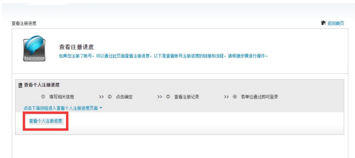
<个人注册进度查询示意图 2>