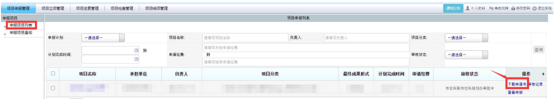
<下载申请书示意图>

当审核状态显示为“市社科联市社科规划办审批中”时，项目申请人/项目承担单位可在申报项目列表，点击操作列【下载申请书】按钮下载申请书。