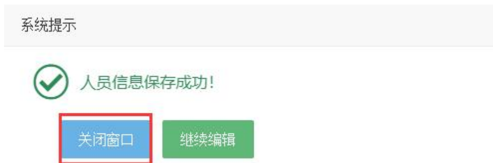
〈完善个人信息示意图 2〉