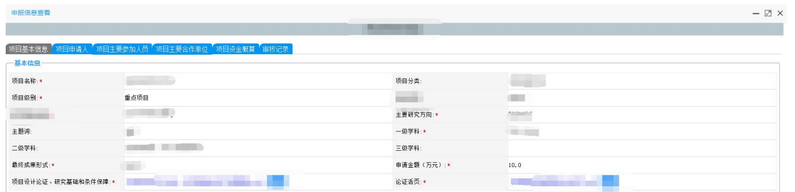
<查看项目申报信息示意图 2>