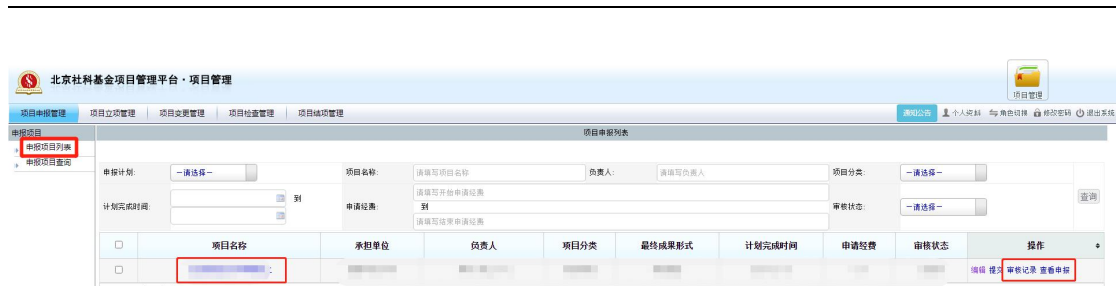
<查看项目申报信息示意图 1>