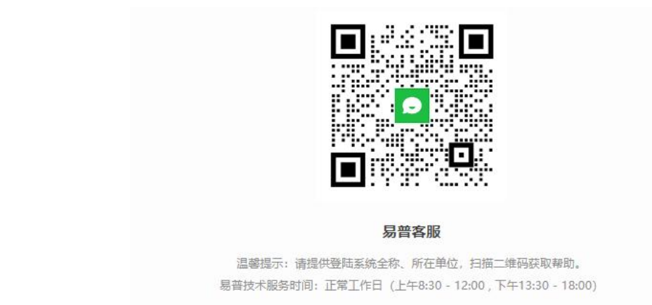
<技术支持服务二维码示意图>

如申报中出现技术故障，可通过点击个人账号左下方“点击联系客服”或根据页面提示扫描服务二维码，平台提供在线人工服务。