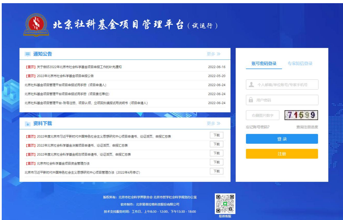
〈平台登录界面示意图〉

https://keti.bjsk.org.cn/，进入到登录页面，平台登录页面如图所示：